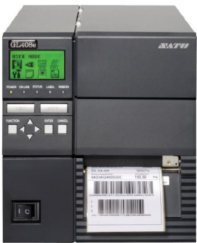
PRISYM Design Software: kompatibel mit über 500 Drucksystemen führender Hersteller