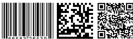
1D Barcode und 2D Codes (DataMatrix & QR Code)

PRISYM Design erzeugt alle gängigen Barcodes plus 2D Codes wie den QR-Code und Datamatrix mit einem Klick. Bei komplexen Barcodes wie EAN128 und GS1 hilft Ihnen unser Eingabe-Assistent weiter.