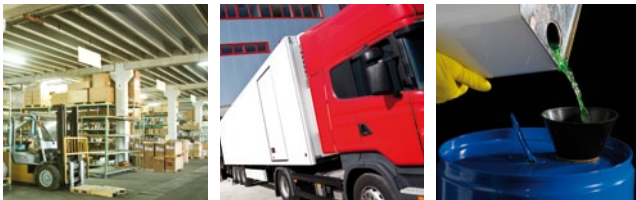
* Wettbewerbsvergleich B-EX4T2 im Stand-by Mode.

Der B-EX4T2 ist erhältlich als 203/300 oder 600 dpi Variante und bietet damit für Spezialisten höchste Druckauflösung und beste Druckqualität.